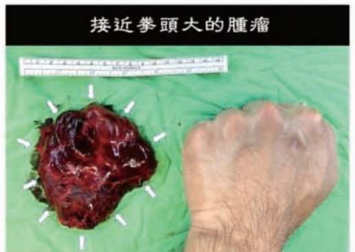
接近拳頭大的腫瘤

經手術前詳細說明與評估，病患成功透過達文西機械手臂來完成了巨大縱隔腔腫瘤的微創摘除手術，避免了因需要鋸開胸骨這樣大傷口的傳統術式所造成的副作用及後遺症，且輕鬆的在手術後第2天出院。返家後，病患迅速回到工作崗位及回歸正常的家庭生活，正是外科醫師為何皆希望能以微創的方式來替病患手術，而達文西機械手臂更是比內視鏡有著更顯著的微創優勢。