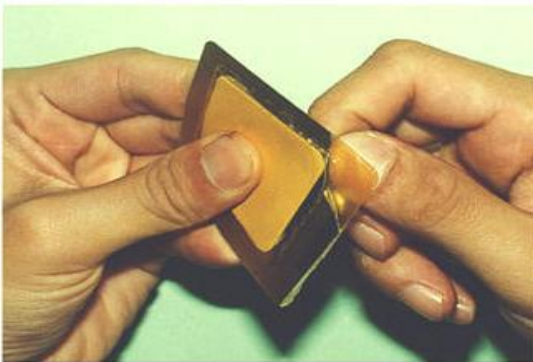
① → 撕開PTP泡殼