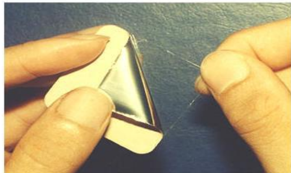
⑤ 膚色面向上，內面黏膠部分貼在乾燥、乾淨無毛髮處。